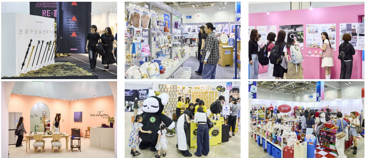
2025 부산디자인페스티벌 행사 사진